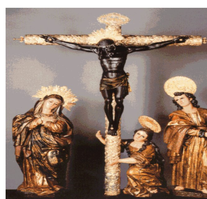
Nuestro Señor de Esquipulas

Tú Señor, que eres la salud de los enfermos, ponemos junto a tu cruz a todos los enfermos que amamos y nuestras propias dolencias porque para Ti no hay nada imposible. Tu que todo lo conoces, ten compasión de todos nosotros. Visítanos y renueva nuestra fe y confianza en Ti; te lo suplicamos, Jesús. Ten compasión de los que sufren en su cuerpo, en su corazón y en su alma y que ponen su confianza en ti, para encontrar paz, para sentir alivio, para sentir tu misericordioso amor. Sánanos Señor, porque tu eres grande, porque eres bueno, sana mi alma de tanto dolor. Gracias por los enfermos que Tú estás sanando ahora, que Tú estás visitando con tu misericordia. Amen .