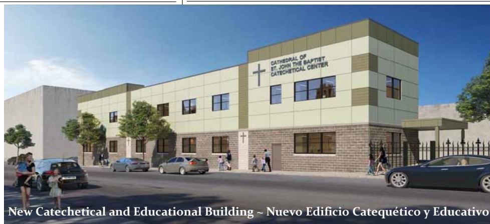
New Catechetical and Educational Building ~ Nuevo Edificio Catequético y Educativo

Every Friday after the 12:30 PM Mass until the 7:00 PM Mass.