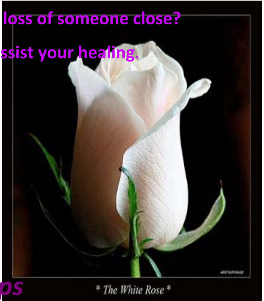
* The White Rose *