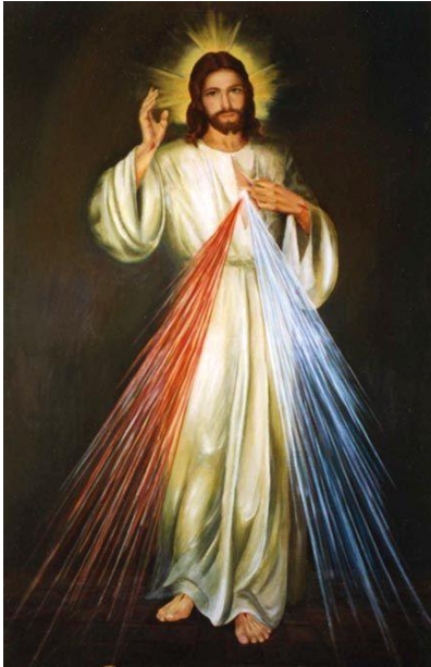
Jesus I trust in you / Jesús confío en ti