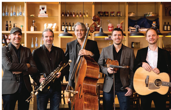
Lúnasa: Christmas from Ireland , próximamente, en diciembre, en el Centro Sheen .

Catholic Faith Network (ex-Telecare) para brindar una programación que comenzará con una serie llamada Live from the Sheen Center . Dicha programación incluye un animado debate, grabado, entre Ross Douthat de The New York Times y James Martin, S.J., de la revista America . En dicho debate, denominado “ Civility in America ” (Civilidad en los Estados Unidos) se discuten cuestiones de religión en EE.UU. Este mes también se ofrecerá contenido selecto a través