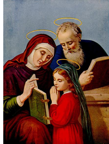
le 26 juillet Fête de Sainte Anne et saint Joachim Parents de la Vierge Marie

Dear Saint Anne and Saint Joachim , you who were grandparents to Baby Jesus, pray for us. You who knew the anguish of parenthood, pray for us. Pray that we will accept the plan of the almighty, and that we will place all our trust in the Lord, and accept the role He demands of us in life.