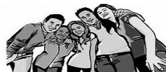
Young Adult Ministry