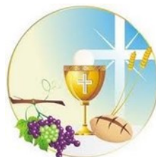
Pão e Vinho Alimento da Vida

Grupo de Oração da RCC se reúne nas segundas às 19:30hs na Igreja.