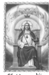
Christ, our King