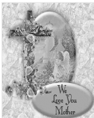
Happy Mother's Day

Najdroższym Mamom Niech miłość Boga i Waszych Dzieci zawsze opromienia Wasze Życie. Niech żadna troska nigdy nie zasmuci Waszego czoła. Matka Najświętsza, Królowa Różańca św., niech otacza płaszczem swej opieki i wyprasza wiele łask w wypełnianiu Matczynego powołania.