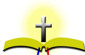
THÁNH KINH HOLY BIBLE