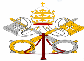
GIÁO HUẤN GIÁO HỘI MAGISTERIUM