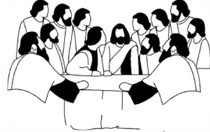
THÁNH TRUYỀN HOLY TRADITION