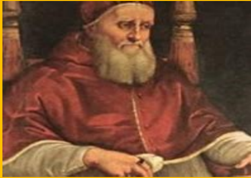
SAINT ROMUALD (c. 951-1027) June 19

“God so loved the world,” declares John 3:16. “Do not love the world,” warns 1 John 2:15. The “world” to love: this planet, entrusted to our stewardship, and its people, God’s children all. The “world” to flee: “sensual lust, enticement for the eyes, and a pretentious life” (1 John 2:16). Born in nobility, Romuald’s conversion followed the shock of witnessing his father murder an enemy. Renouncing his privileged world, Romuald sought God’s world in monastic life. Its winding turns and several dead ends make Romuald’s journey resonate with all who find life more maze than superhighway. Both the hermit’s solitary struggle and community life’s unique challenges shaped Romuald’s legacy: his vast Camaldolese Benedictine family of monks, nuns, and lay associates who, these thousand years later, from the mountain solitude of Camaldoli, Italy to an urban monastery in Berkeley, California—in Asia, Africa, South America, Europe—integrate Romuald’s experience into their witness of solitary prayer, communal charity and worship, and promotion of contemplative spirituality in this world that can so easily distract us from the God who loves it still.