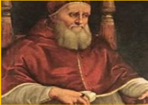
San Romualdo (c. 950-1027)