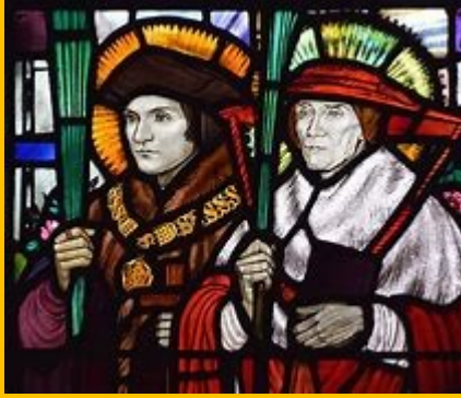
SAINT JOHN FISHER (1469-1535) AND SAINT THOMAS MORE (1477-1535) June 22

From Robert Bolt's classic A Man for All Seasons to Showtime's edgy The Tudors , Thomas More endears himself still: lawyer-statesman of impeccable integrity, remarried widower and affectionate father delighting in a lively household—four children, a pet monkey, even a paid jester! And challenges still: humanist-reformer, yet champion of Catholic faith and papal primacy. John Paul II named him Patron of Statesmen and Politicians, citing More's generous work, both as a lawyer and in government service, on behalf of the poorest and most marginalized people of his time, as well as his promotion of education for all sectors of society. More's decision for principle over politics, conscience over convenience prompted his final words: "I die the king's good servant, but God's first." Alone among England's bishops, John Fisher dared challenge Henry VIII's divorce and repudiation of the papacy. When the Pope named the imprisoned Fisher a cardinal, Henry thundered: "Don't bother sending Fisher's red hat here; I'll send Fisher's head to Rome!" Whose "good servants" are we first? Isn't a right conscience worth the pain of standing alone?