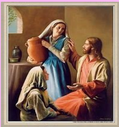
SAINT MARTHA (first century)