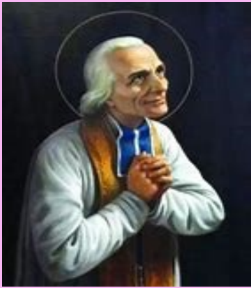
SAINT JOHN MARY VIANNEY (1786-1859)