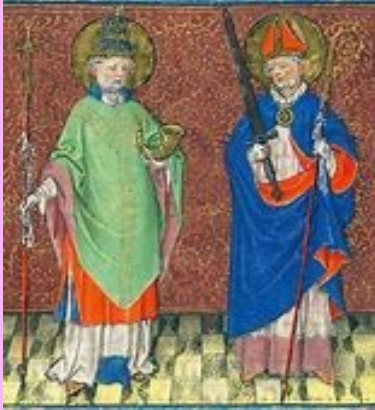
SANTOS CORNELIO (año 253) Y CIPRIANO (año 258) 16 de septiembre

Cornelio era un ciudadano romano que sucedió a san Fabián en el papado, luego de 14 meses sin obispo. El candidato que aspiraba al cargo le creó serios problemas, pues calificó de ilegítima la elección papal de Cornelio. Además, se oponía a que se recibiera en la Iglesia a los apóstatas, mientras que el Papa Cornelio sostenía que sí, que podían ser readmitidos luego de una penitencia. En el 253 se declaró una persecución contra los cristianos y Cornelio fue desterrado sufriendo el cautiverio y posteriormente la decapitación. Durante su destierro recibió una carta del obispo Cipriano, quien le felicitaba por sufrir en nombre de Cristo. Este obispo se había convertido a los 45 años al cristianismo, renunciando a su vida placentera y abrazando no sólo el Evangelio, sino también a los autores cristianos, entre ellos a Tertuliano, quien le influyó notablemente. Gracias a su conocimiento de oratoria y retórica impulsó enormemente el cristianismo en África. Como obispo, fue firme y caritativo, enfrentó la persecución y fue decapitado. Ambos, Cipriano y Cornelio son recordados en la Plegaria Eucarística I del Rito Romano.