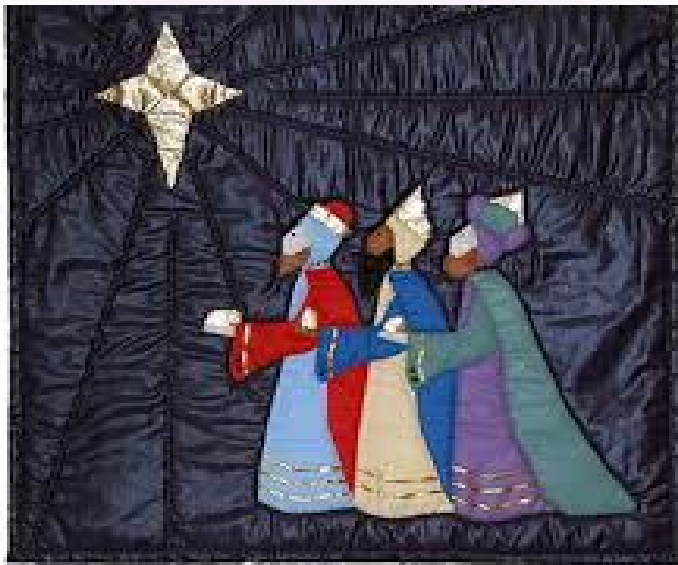
Los Más Pequeños

Ven el próximo Domingo 6 de Enero del 2019 y celebra con los Tres Reyes Mayos en la misa de las 11:30 am.