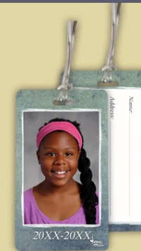
BACKPACK TAG Etiqueta para mochila