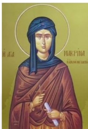
św. Makryna Młodsza