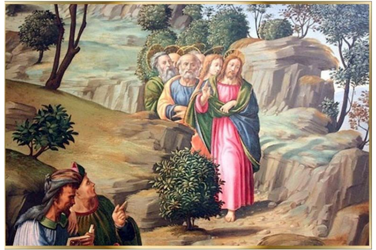
«Te seguiré a dondequiera que vayas.»