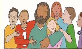
© J. S. Paluch Co., Inc.

Today Jesus stresses how children embody the reign of God. They are trusting and loving and have hearts that are open to love. They are joyful when they are made aware of God's love for them, and are eager to return that love. This is the model Jesus holds out to us if we want to welcome the reign of God. We need to have open, loving hearts. We must drop our defenses, however we came by them, and welcome Christ's love for us with joy. This is impossible for us on our own. Only the grace of God will enable us to do this, but that grace is freely and generously given. We have only to accept it. Copyright © J. S. Paluch Co., Inc.