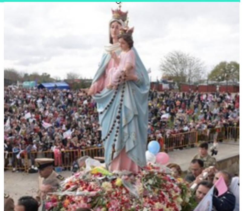
El 8 de diciembre de 1854 del Papa Pío IX proclamó como dogma de la fe católica la Concepción Inmaculada de la Virgen Santísima.

En Roma se envió una gran cantidad de palomas mensajeras en todas las direcciones llevando la gran noticia. Y en los 400 mil templos católicos del mundo se celebraron grandes fiestas en honor de la Inmaculada Concepción de la Virgen María.