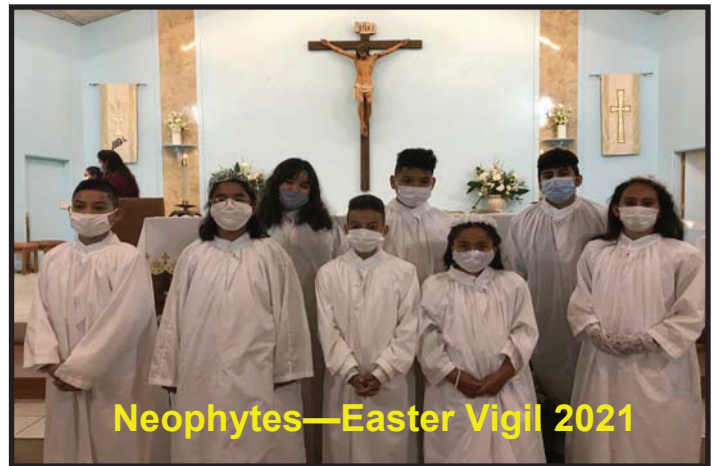
Neophytes—Easter Vigil 2021

Grupo Carismático Luz en el Espíritu, 7 pm, Iglesia