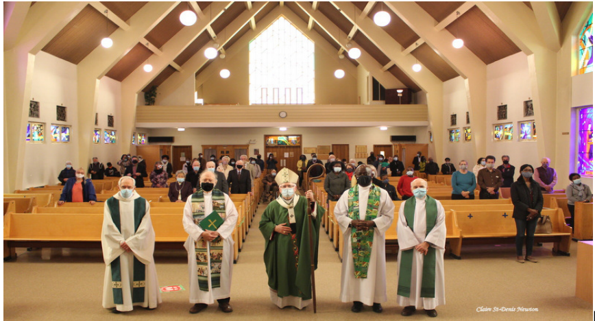
es concélébrants avec l'assemblée (dispersée à cause de COVID)

Aujourd'hui, Jésus nous nourrit de sa Parole et de son Pain. Depuis longtemps, il nous invite à pratiquer la foi, l'espérance et la charité. Il nous donne le nécessaire pour que nous puissions vivre dans sa paix et dans sa joie, même en ces temps difficiles, alors que l'avenir nous paraît incertain.