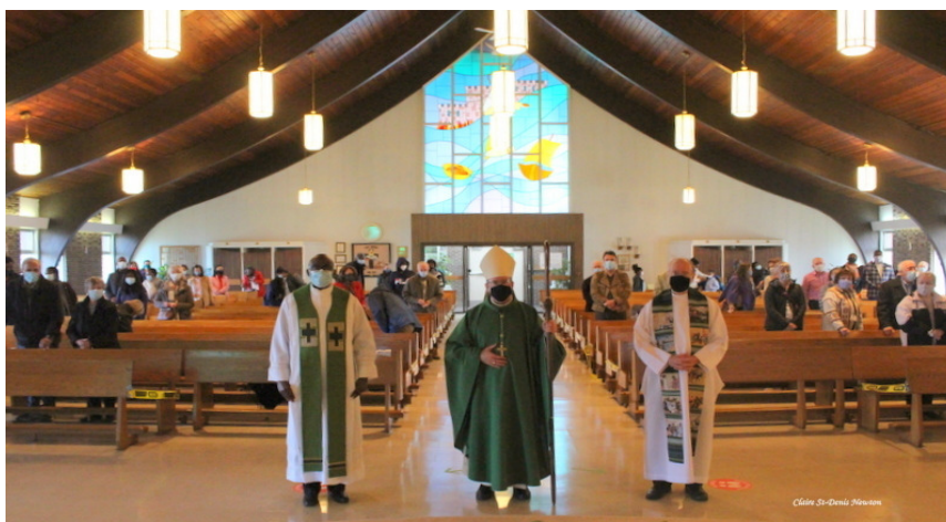
Les concélébrants avec l'assemblée à la fin de la messe