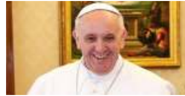
PAPA FRANCISCO AUDIENCIA GENERAL Abril 29, 2020