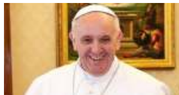
PAPA FRANCISCO AUDIENCIA GENERAL May 13, 2020

Queridos hermanos y hermanas: Siguiendo con el tema de la oración que iniciamos la semana pasada, consideramos cómo la oración nos pertenece a todos, a los hombres de todas las religiones, y probablemente a los que no profesan ninguna. La oración surge en el secreto de nosotros mismos, en ese lugar interior que los autores espirituales a menudo llaman el “corazón”. Rezar no es algo externo ni marginal a nosotros, sino que es el misterio más íntimo de nosotros mismos, que nace como una invocación en lo profundo de nuestra persona y se extiende, buscando un “Tú”, que es Dios. La oración del cristiano surge de la revelación de ese “Tú”, con mayúscula, que se ha manifestado y ha venido a nuestro encuentro, dándonos confianza y revelándonos a Dios como un Padre bueno, que nos ama y nos comprende, que no nos considera siervos, sino amigos e hijos suyos. En la oración del Padre Nuestro, Jesús nos enseñó a pedir a Dios todo lo que necesitamos. No importa si nos sentimos culpables en nuestra relación con Él, si no hemos sido amigos fieles, ni hijos agradecidos; Dios siempre continúa amándonos, porque Él siempre es fiel.