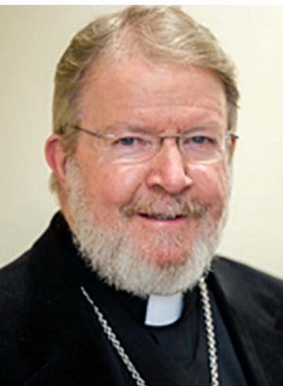
Bishop Liam Cary

No, 2021 Appeal parish goals are not mandatory, but all parishes are expected to participate in the Appeal and generate a substantial amount of in-pew pledges. Each parish should strive to achieve 100% of its parish goal.