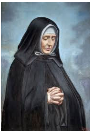
Santa Juana Jugan (10/25/1792 - 08/29/1879)

Santa Juana Jugan dedica su vida a los más necesitados de los ancianos pobres. Su servicio resultó en el establecimiento de las Hermanitas de los Pobres que cuidan a los ancianos que no tienen otros recursos en todo el mundo.