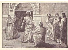
Doute de saint Thomas