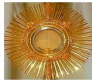
Loué soit à tout instant Jésus au Saint Sacrement!

Loïn d'être seulement une fête de dévotion, la fête du Saint-Sacrement du Corps et du Sang du Christ ou Fête-Dieu est une profession de foi, malheureusement omise dans la formule du credo. Le peuple chrétien célèbre et vénère la présence réelle et permanente du Christ à travers les espèces du pain et du vin consacrés, mais aussi la fraction du pain, le repas communautaire et la communion entre les fidèles entre eux et avec le Christ. Aujourd'hui, les textes bibliques de la liturgie soulignent l'aspect sacrificiel de l'Eucharistie, sacrifice de louange et d'action de grâces. Dans le Premier Testament, elle a été un sacrifice de réconciliation dans le sang des animaux offerts et immolés, gestes répétitifs et une Alliance entre Dieu et son peuple.