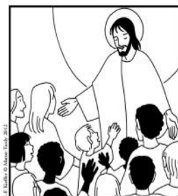
1 er dimanche de l'Avent – Année C

Seigneur Jésus, je me tiens debout devant toi, prêt à t'accueillir, amen.