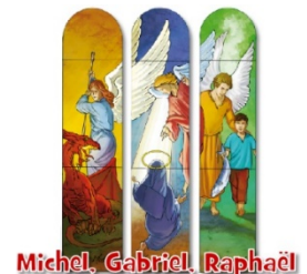
Michel, Gabriel, Raphaël