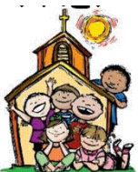
Parish Religious Education Program