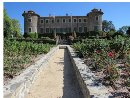
Castelo do Marquês LaFayette em Chavaniac