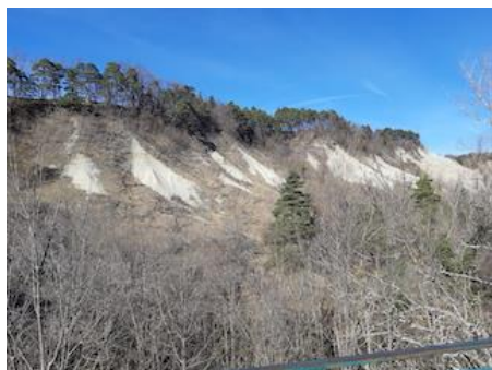
Colinas de cal em Rosières