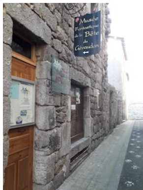
Museu da Besta de Gévaudan em Saugues