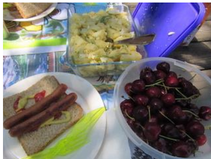
Almoço piquenique em Paulhauguet