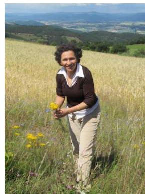
Campo de trigo perto de Langeac