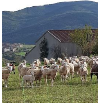
Ovelhas perto de Chilhac

Antes e depois do fechamento da primavera, o interior da França nos acenou para sairmos do Centro para fazermos vários passeios de um dia. À medida que seguíamos pelas estradas de duas pistas suaves e bonitas, ficamos mais familiarizados com muitas das pequenas cidades que cercam Le Puy. Felizmente, estamos localizados geograficamente no Maciço Central, que possui montanhas e planaltos e oferece vistas deslumbrantes.