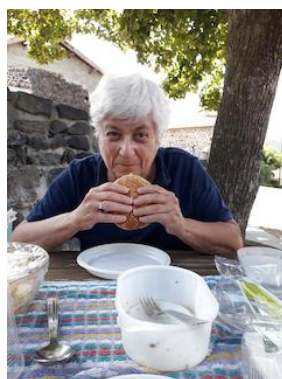
Dia Nacional do Cheeseburger em Bouzol com vista para o vale do Rio Loire