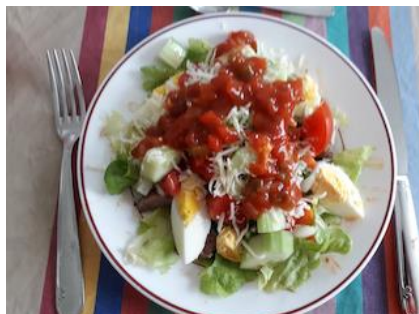
Insalata di taco