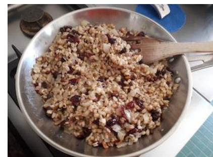
Riso, mirtili, cipolle, nocciole