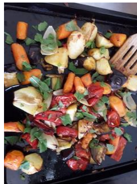
Legumi alla griglia.

Uno dei nostri “passatempi” durante questo periodo privo di ospiti e di visitatori, è stato quello di provare nuove interessanti ricette. Abbiamo sperimentato molti piatti internazionali, in particolare cinesi, thailandesi, marocchini, medio orientali, italiani, messicani, francesi e americani. Ecco delle foto delle nostre migliori riuscite. Queste nuove ricette saranno ad aspettarvi al vostro ritorno al Centro.