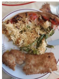
Pesce e pizza “alla francese”