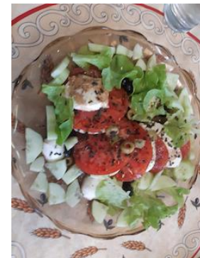
Salada de tomate e mussarela