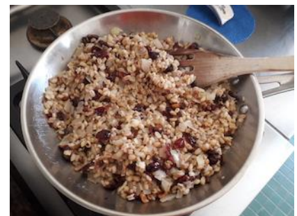
Arroz, cranberries, cebolas e avelãs