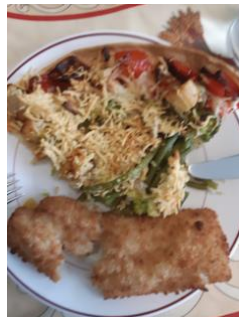
Peixe e pizza "alla francese"