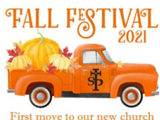
First move to our new church