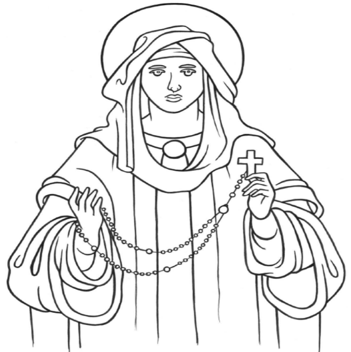
Our Lady of the Rosary