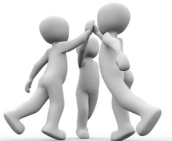
Favoriser une culture de sécurité