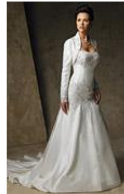
No requiere un chal