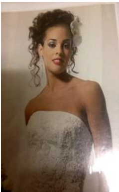
Requiere un chal

Por favor tengan en cuenta la virtud de la modestia cuando escojan su vestidos, los de sus invitados (aquellos en la procesión), y los de los lectores. Ustedes estarán rezando en un lugar sagrado, por lo tanto NO SE PERMITEN los vestidos sin tirantes, tirantes delgados, con mucho escote, o con la espalda desnuda . Si vienen vestidos inapropiadamente se requerirá que usen algunos de los chales de la iglesia. Ustedes pueden traer sus propios lindos chales o chaleco bolero, los que pudieran ser de encaje o de tela muy fina. Los vestidos también deberán llegar al menos a la altura de las rodillas y no tener brillantina.