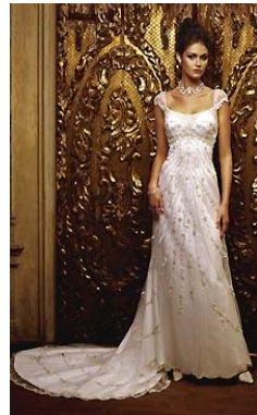
No requiere un chal