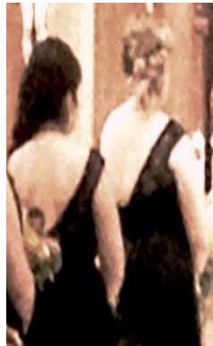
Requiere un chal