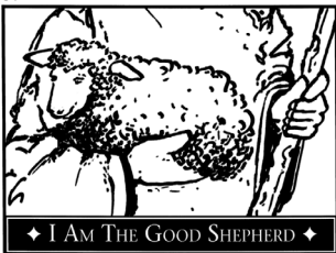
◆ I AM THE GOOD SHEPHERD ◆

El silencio es un regalo de Dios que nos permite hablarle más íntimamente.