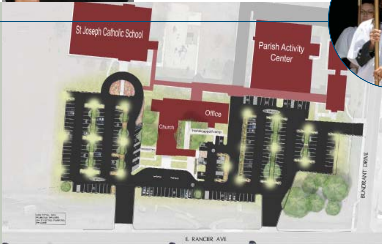
Proyecto de Estacionamiento