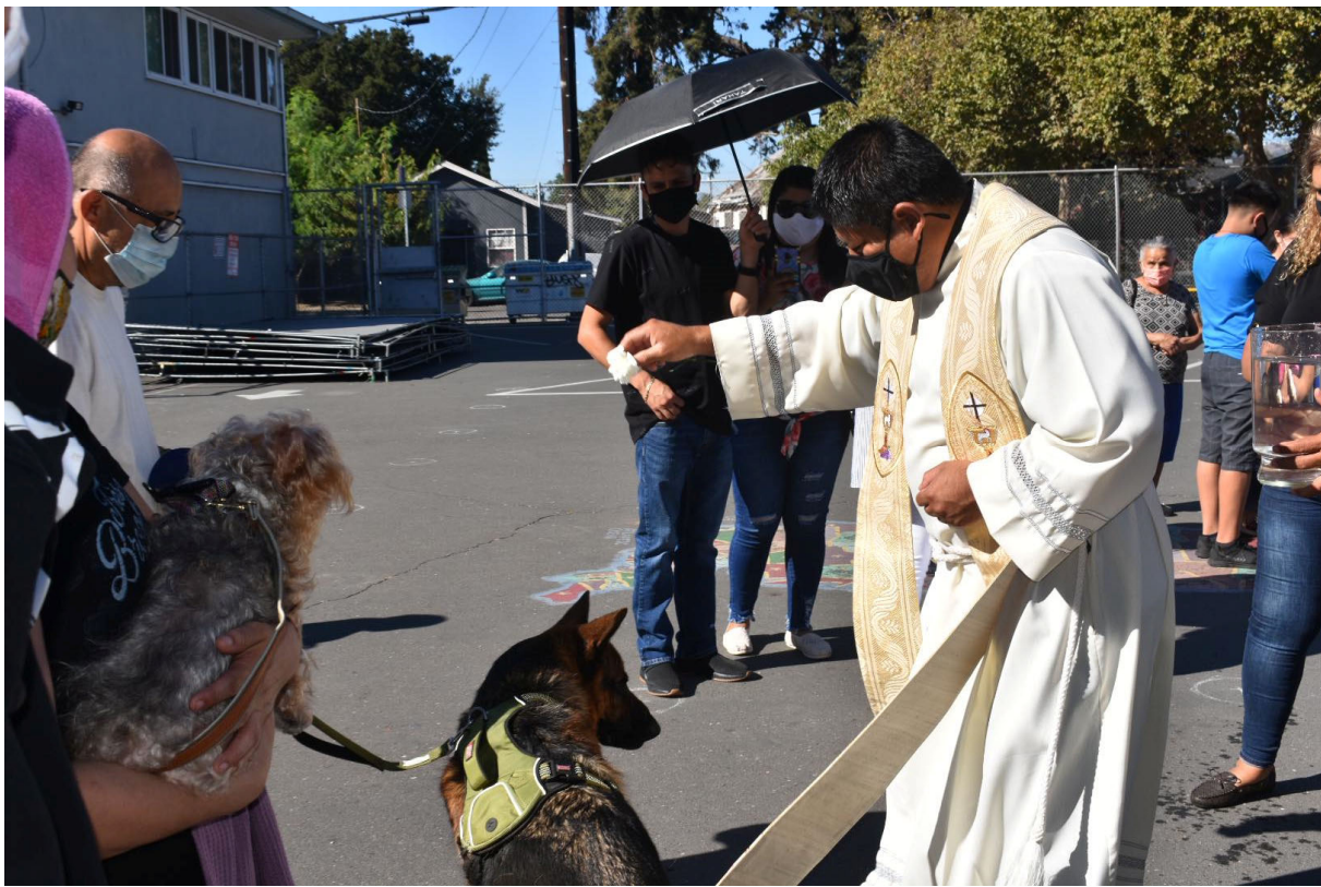
Bendición de los animales—4 de octubre 2020 Blessing of the animals—October 4th 2020

Twenty-ninth Sunday in Ordinary Time-October 18, 2020 Vigésimo Noveno Domingo del Tiempo Ordinario 18 de octubre 2020