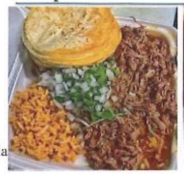
Plato de Birria $13.00