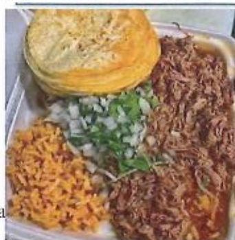
Birria Plate Sale $13.00