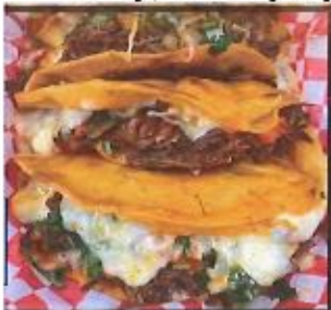
Quesabirrias (Quesadilla with birria Meat inside)

Today, Sunday April 11 th after each mass