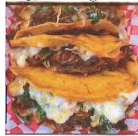
Quesabirrias (Quesadilla con birria adentro)

Hoy, Domingo 4 de Abril Despues de cada Misa