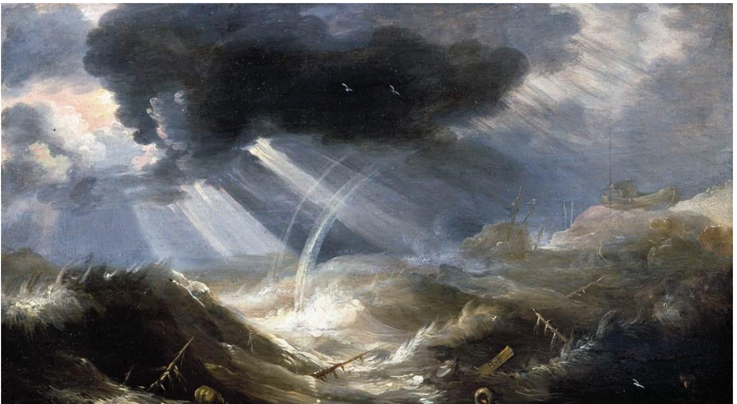
"The Covenant of Noah"